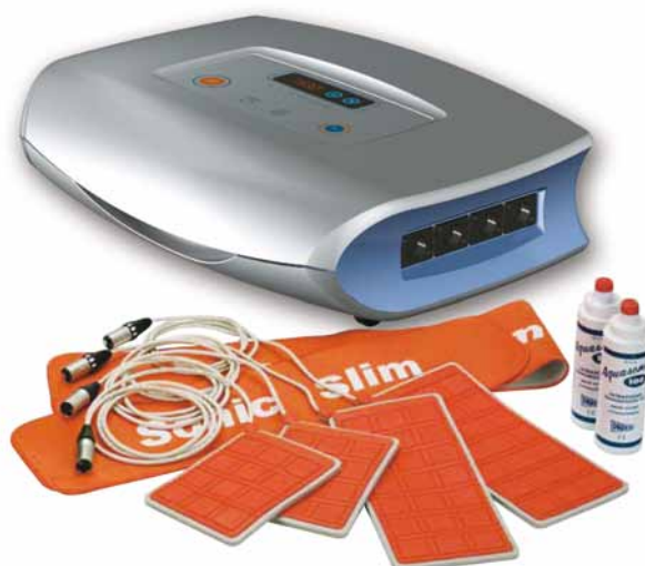
Plaques de traitements

OPTION : pour une utilisation médicalisée sur les sujets obèses, nous vous proposons le NARL [GX] qui est plus indiqué grâce à ses 168 cellules sur 8 pads de traitement.