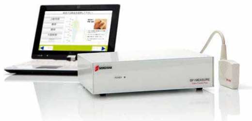
Echographe Cellu S.MET

Il mesure automatiquement l'indice de graisse corporelle, la rétention d'eau et la masse musculaire. Le rapport ultrasonographique donne un compte rendu précis en moins de 5 minutes qui permet de faire une évaluation clinique complète.