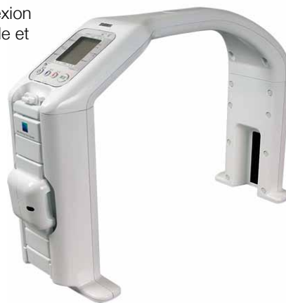
Diagnostic des graisses viscérales